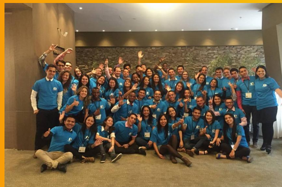
Grupo de profesores voluntarios Colombianos de Español. Programa APC Colombia Julio 2016