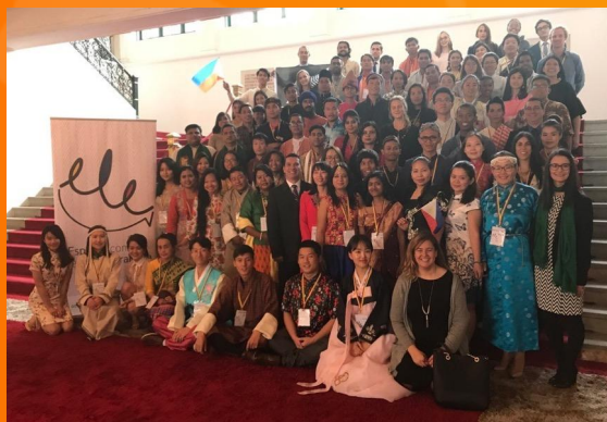
Grupo de estudiantes de español. Programa ELE Focalae, Ministerio de Relaciones Exteriores. Julio 2017