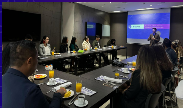
Evento en Bogotá y en Tegucigalpa tuvimos un espacio con nuestros aliados donde hablamos sobre las tendencias de talento humano y fortalecimos las relaciones para promover la empleabilidad de los PRO.3