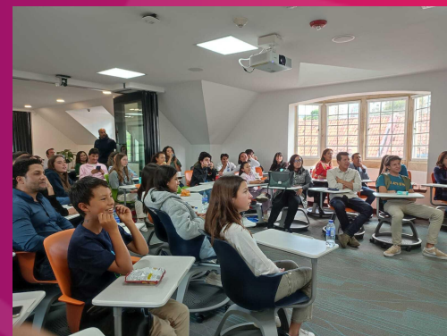
Espacio de formación presencial de dos semanas con niños y adolescentes en la universidad CESA, sobre proposito, orientación vocacional, liderazgo y sostenibilidad.