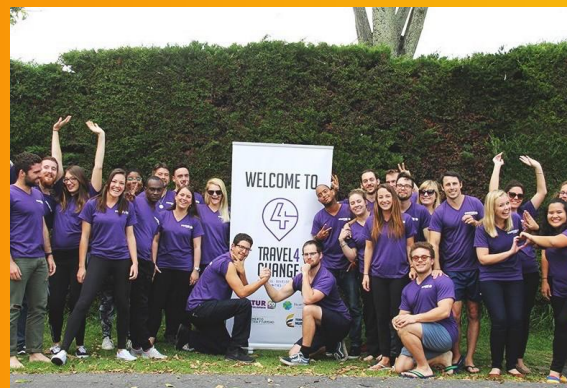
Grupo de Formadores de Turismo. Programa Ministerio de Industria, Comercio y Turismo. Julio 2017