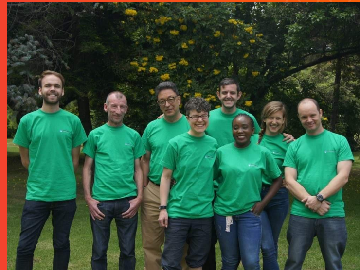
Grupo de profesores de English4 Marzo 2023