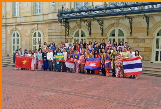
Grupo de estudiantes de español. Programa ELE Focalae. Ministerio de Relaciones Exteriores. Febrero 2016