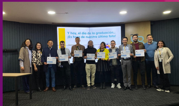
Ceremonia de grado Banco de Bogotá, 2024