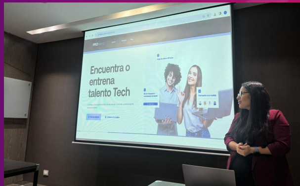
Evento de lanzamiento landing page para organizaciones, 2022