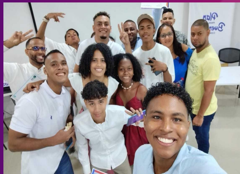
La trainer con su grupo de trabajo, eran talentos de comunidades vulnerables de Cartagena.