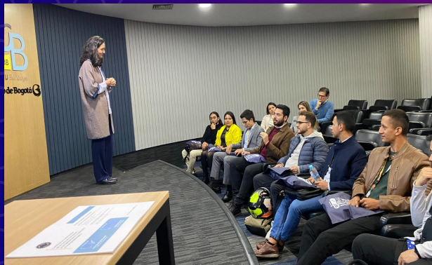
Ceremonia de grado Banco de Bogotá, 2024