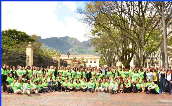
Grupo de profesores voluntarios formadores extranjeros. Programa MEN Junio 2016