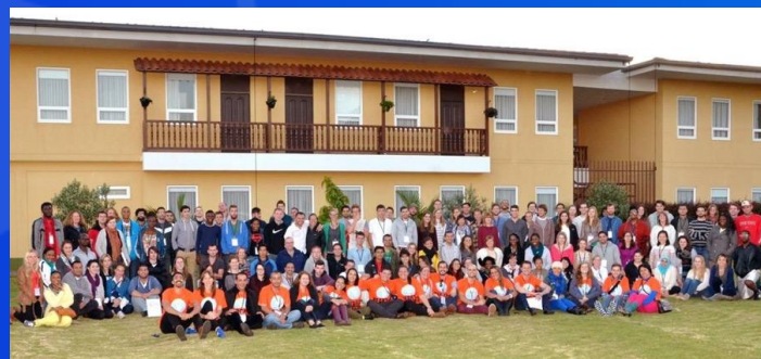
Grupo de profesores voluntarios formadores extranjeros. Programa Ministerio de Educación. Enero 2015