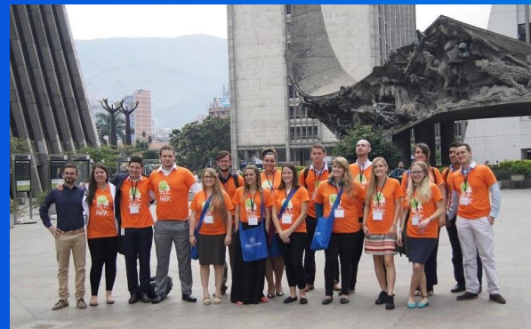
Grupo de profesores voluntarios formadores extranjeros. Programa GOBERNACIÓN DE ANTIOQUIA. Junio 2015